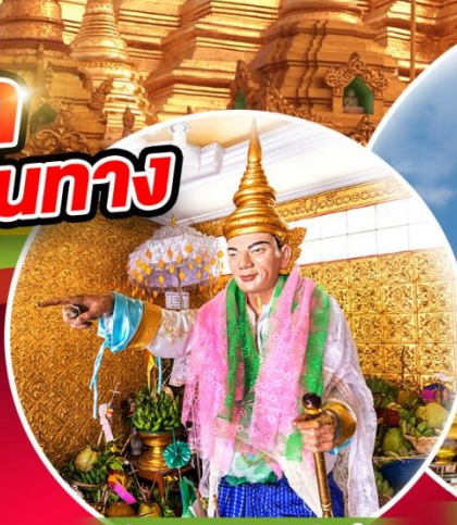
สักการะเทพทันใจ