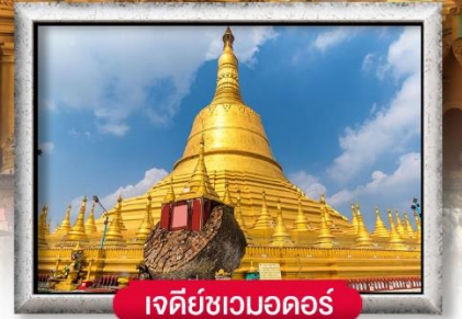
เจดีย์ชเวดอดอร์

เมนู สุดพิเศษ | กุ้งแม่น้ำเผา + บุฟเฟ่ต์นานาชาติ