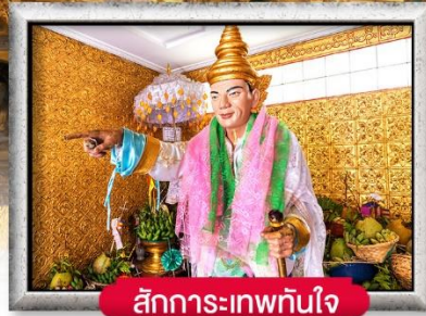
สักการะเทพทันใจ