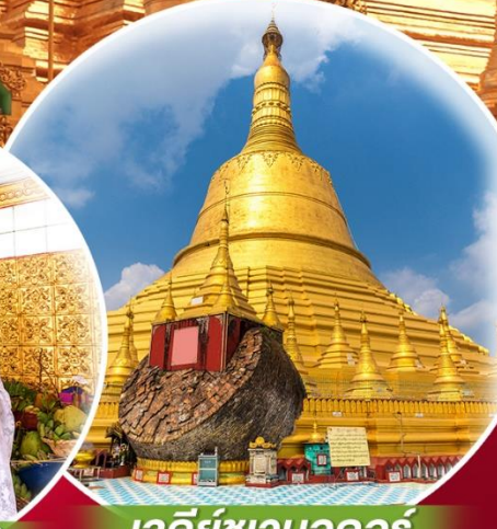
เจดีย์ชเวมอดอร์

มหัศจรรย์ เมียนมาร์ ย่างกุ้ง • หงสาวดี • ใจ้โท