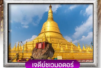
เจดีย์เขมอดอร์

พิเศษ!! BUFFET HOTPOT และ SEAFOOD นานาชาติ