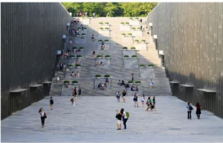
มหาวิทยาลัยฮอวา