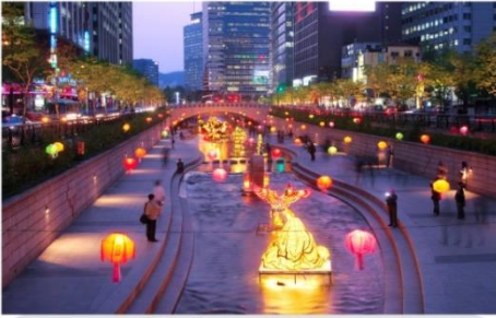
เทศกาลโคมไฟ