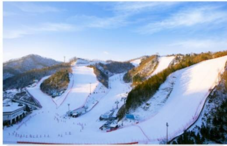
สกีรีสอร์ท กิจกรรมลานหิมะ