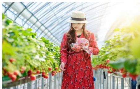
ฟาร์มสตรอว์เบอร์รี่ออร์แกนิก