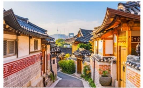
หมู่บ้านโบราณซูกซอน