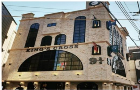
คาเฟ่แอร์พोटเตอร์