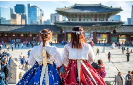
พระราชวังเคียงบก