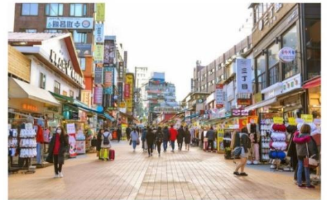
ย่านฮงแด