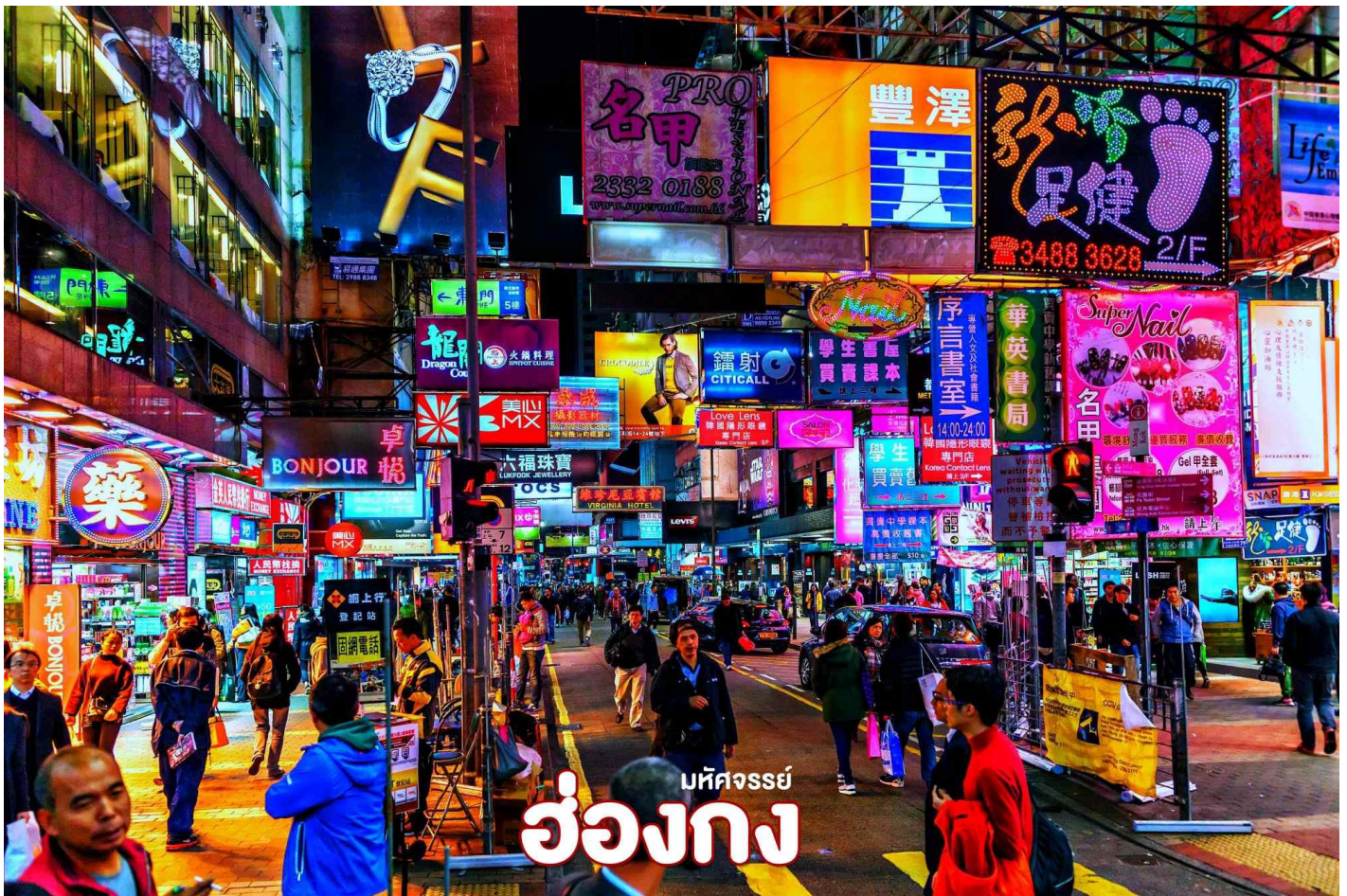
มหัศจรรย์ ฮ่องกง

นำทุกท่านอิสระช้อปปิ้ง ย่านมงก๊ก แหล่งช้อปปิ้งที่เต็มไปด้วยตรอกซอกซอยที่มีเอกลักษณ์แปลกตา รวมทั้งตลาดเก่าแก่ที่สะท้อนเสน่ห์ และวิถีชีวิตของคนท้องถิ่น ถือเป็นหนึ่งในย่านยอดนิยมที่นักท่องเที่ยวทุกคนต้องแวะเวียนมา มีร้านสวยๆ บาร์เท่ๆ หลบซ่อนตัวอยู่มากมาย ภายในย่านมีตลาดนัด Ladies' Market ขนาดใหญ่ซึ่งมีร้านขายเสื้อผ้า และของกระจุกกระจิกให้ได้เลือกซื้อมากมาย