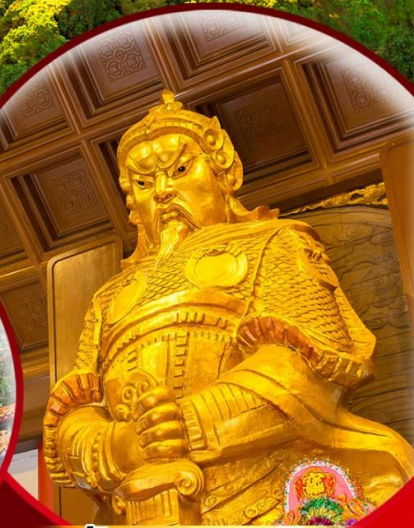
วัดเชกงหวี