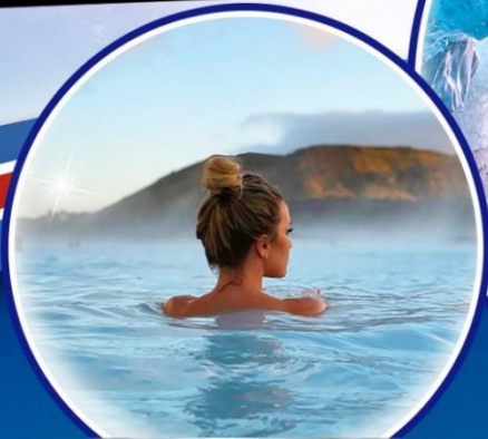
บลูลากูน