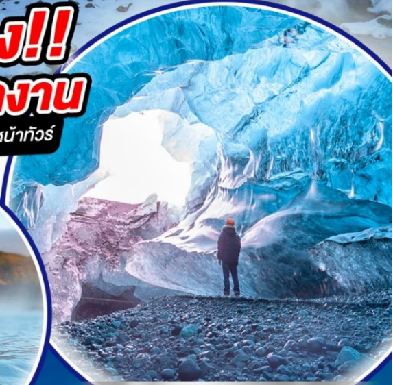
ถ้ำน้ำแข็ง VATNAJOKULL GLACIER