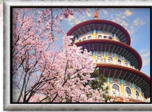
วัดอูจี เกียนหยวน