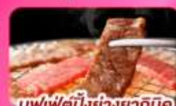
บุฟเฟ่ต์บิงย่างยากินิกุ