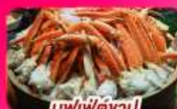
บุฟเฟ่ต์งาปู