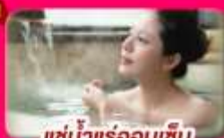
แช่น้ำแร่ร้อนเซ็น