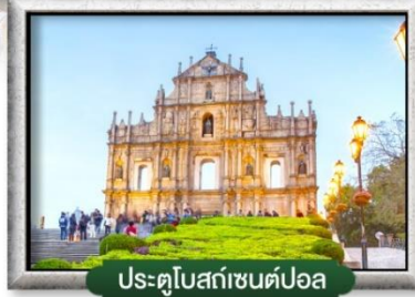
ประตูโบสถ์เซนต์ปอล