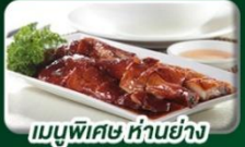
เมนูพิเศษ หน้าอย่าง