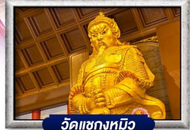
วัดเขangkงทมิว