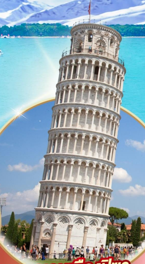
หออนเมืองปิซา