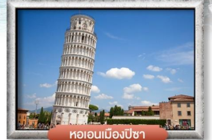
หออนเมืองปิซา

พิเศษ! สปาเกตตี้เส้นหมึกดำ, พิชซ่าสไตล์อิตาลีแสนแท้