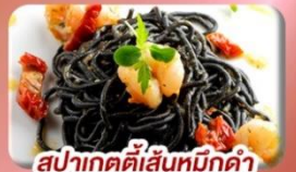
สปาเกตตีเส้นหมึกดำ