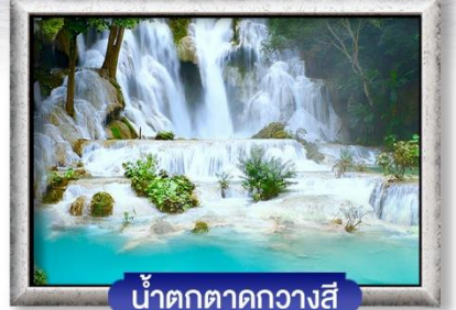
น้ำตกตาดกวาสี