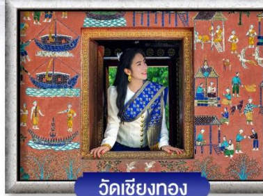
วัดเชียงทอง