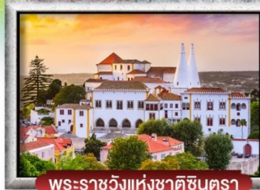
พระราชวังแห่งชาติซันตรา