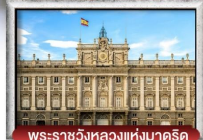
พระราชวังหลวงแห่งมาดริด