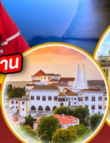
พระราชวังแห่งชาติซินตรา