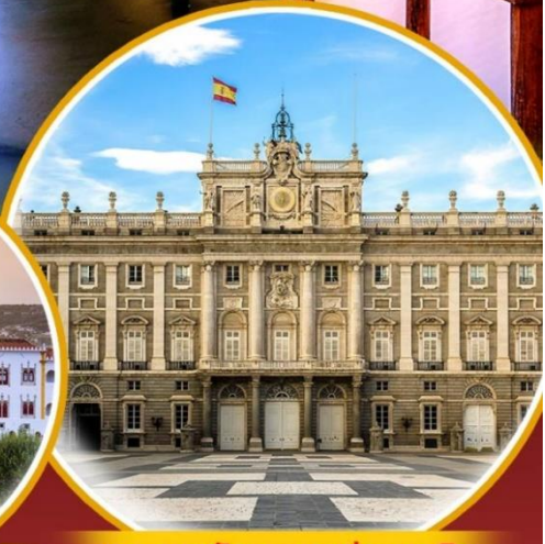
พระราชวังหลวงแห่งมาดริด