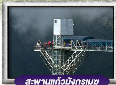
สะพานแก้วมังกรเมฆ