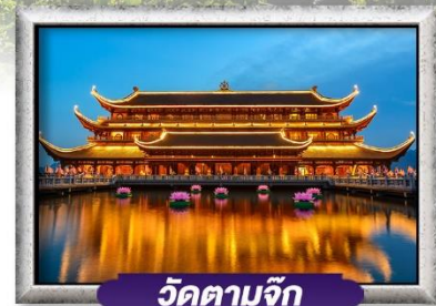
วัดตามจิก