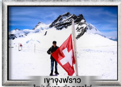
เขาจุงเฟรา ใหม่! ขึ้นกระเช้า ลงรถไฟ