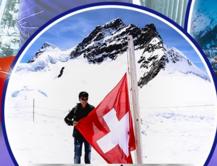
เขาจุงฟราว ใหม่! ขึ้นกระเช้า ลงรถไฟ