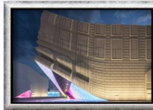
พาราไดซ์ ซิตี้

✔️ เดินเที่ยวย่านอิ๊กซอนดง ซ็อบปิ้งเมียงดง