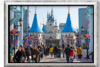
สวนสนุกลิตเติ้ลเวสต์

พิเศษ! BBQ ปิ้งย่างสไตล์เกาหลี , ซิมสตรอว์เบอร์รี่สดๆ จากไร่