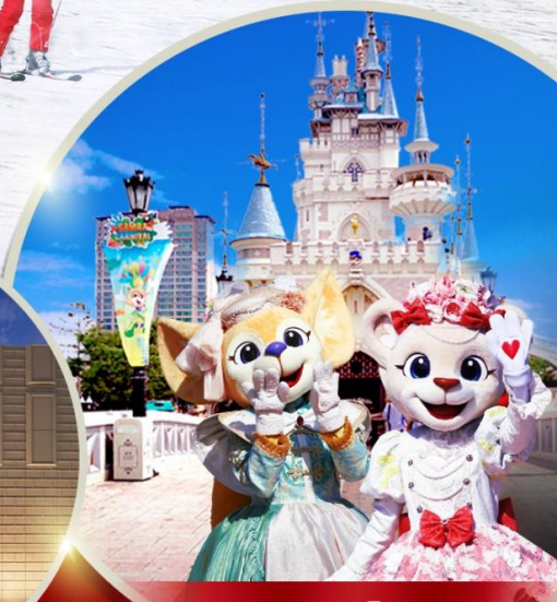
สวนสนุกล็อตเต้