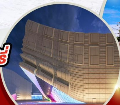
พาราไดซ์ ซิตี้