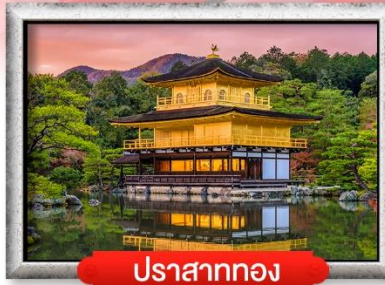
ปราสาททอง