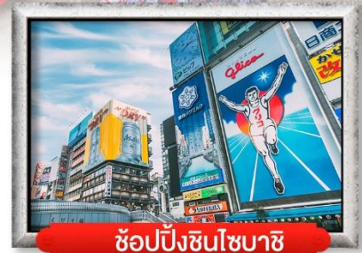
ช้อปปิ้งชินโซบาชิ

เมนู สุดพิเศษ !! บุฟเฟ่ต์ชาบู , หมูย่างไบโอบะ