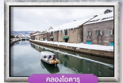
คลองโอตารุ

พิเศษ! บุฟเฟ่ต์ปิ้งย่างยากินิกุ, บุฟเฟ่ต์จายูยักซ์ 3 ชนิด