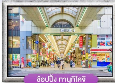
ช้อปปิ้ง ทานุกิโคจิ