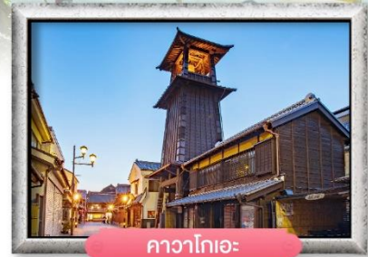
คาวาโกเอะ