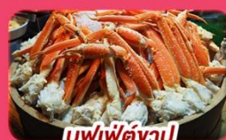
บุฟเฟ่ต์ซาปู