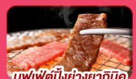
บุฟเฟ่ต์บั้งย่างยากินุกุ

มหัศจรรย์...JAPAN ฟุจิ โตเกียว นาริตะ - หน้า 1 -