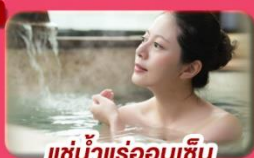
แช่น้ำแร่ร้อนเซ็น