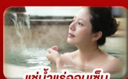
แช่น้ำร้อนเซน