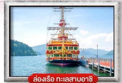
ล่องเรือ ทะเลสาบอาชิ