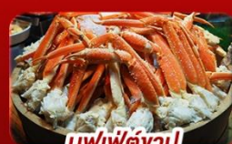
บุฟเฟ่ต์งาปู