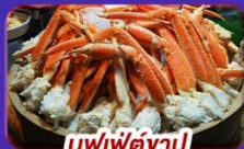
ปูเฟ็ดจานู