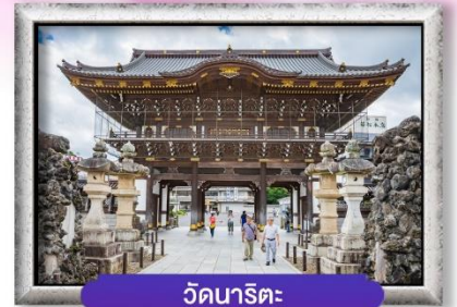
วัดนาริตะ