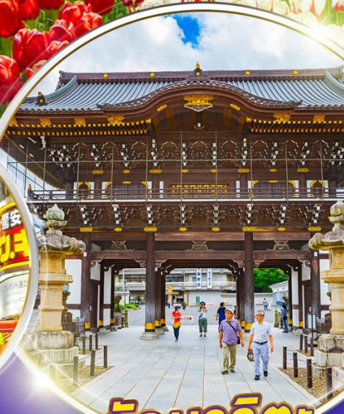
วัดนาริตะ

ชมทุ่งดอกพื้งค์มอส & ทุ่งดอกทิวลิป 1 ปีมีครั้งเดียว