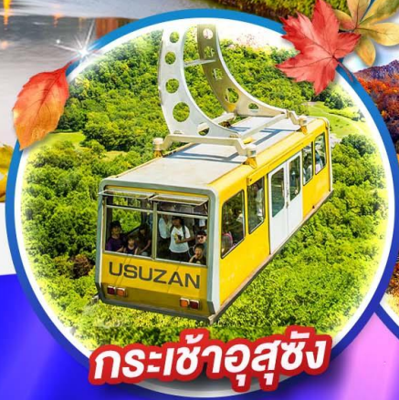
กระเช้าอุซุซัง