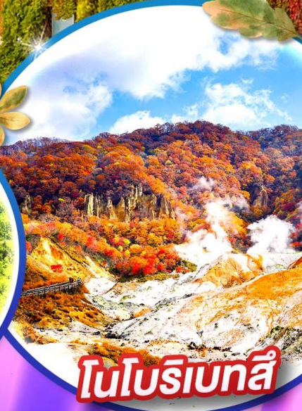
โนโบริเบทสึ