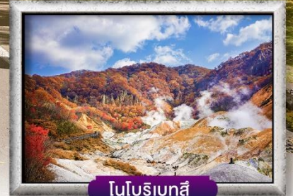
โนโบริเบทสึ