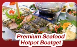
Premium Seafood Hotpot Boatget

นั่งกระเช้าที่ยาวที่สุดในโลก ขึ้นสู่บาน่าฮิลล์ ชมเมือง ฮอยอัน เมืองมรดกโลกที่สวยงามและเจียบสงบ พิเศษ!! บุฟเฟ่ต์นานาชาติ บาน่าฮิลล์ และ Seafood