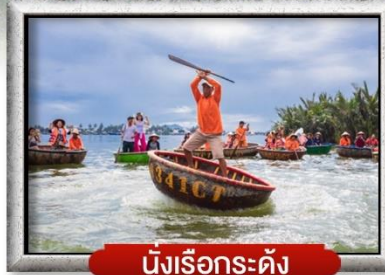
นึ่งเรือกระดิง