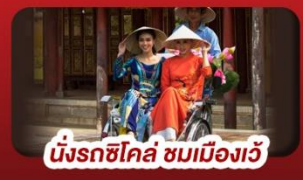
นั่งรถซิคโก้ ชมเมืองเว้