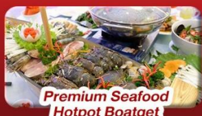
Premium Seafood Hotpot Boatget

นั่งกระเช้าที่ยาวที่สุดในโลก ขึ้นสู่บาน่าฮิลล์ ชมเมือง ฮอยอัน เมืองมรดกโลกที่สวยงามและเจียบสงบ พิเศษ!! บุฟเฟ่ต์นานาชาติ บาน่าฮิลล์ และ Seafood