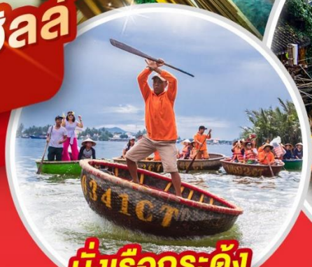
นั่งเรือกระด้ง Hoi An