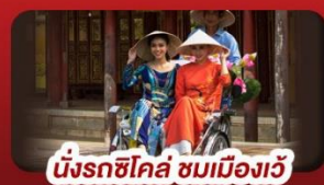
นั่งรถซิคโก้ ชมเมืองวี