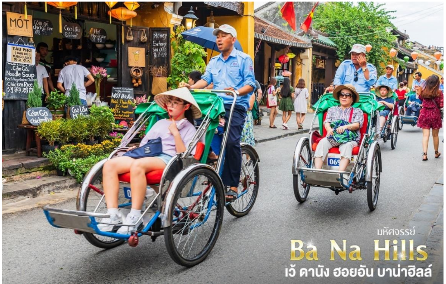
มหัศจรรย์ Ba Na Hills เว้ ดานัง ฮอยอัน บาน่าฮิลล์

เที่ยง ๗ บริการอาหารกลางวัน ณ ร้านอาหาร เมนูพิเศษ Premium Seafood Hotpot Boatget