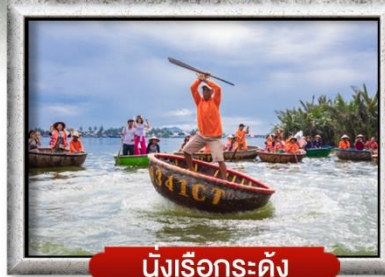
นั้งเรือกระดิง