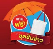
แถมฟรี!! ช๊อปปิ้งจ้าว

มหัศจรรย์...บาน่าฮิลล์ ดานัง ฮอยอัน พักบาน่าฮิลล์ 1 คืน