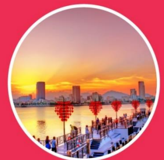
AUTUMN กันยายน-พฤศจิกายน