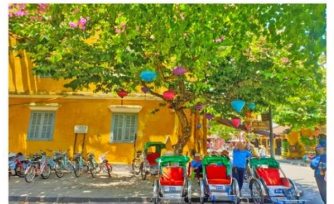
นั่งสามล้อชมเมือง