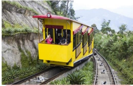
นั่งรถราง