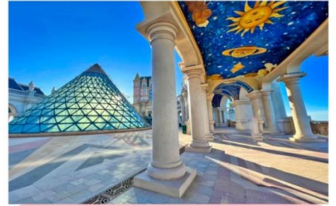
จัตุรัสแห่งดวงดาว