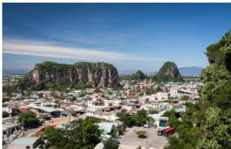
หมู่บ้านเกาะสลักหินอ่อน