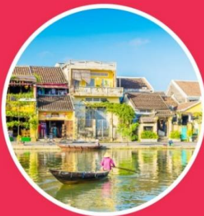
SPRING มีนาคม-พฤษภาคม