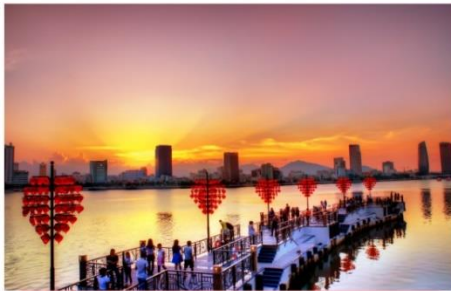
สะพานเลิฟบริดจ์