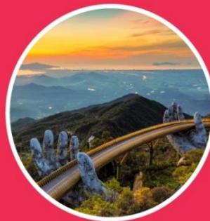
SUMMER มิถุนายน-สิงหาคม