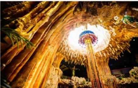
สวนสนุกแฟนตาซีพาร์ค