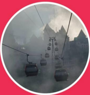
WINTER ธันวาคม-กุมภาพันธ์