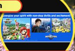
วันอิสระเลือกซื้อบัตรยูนิเวอร์แซล