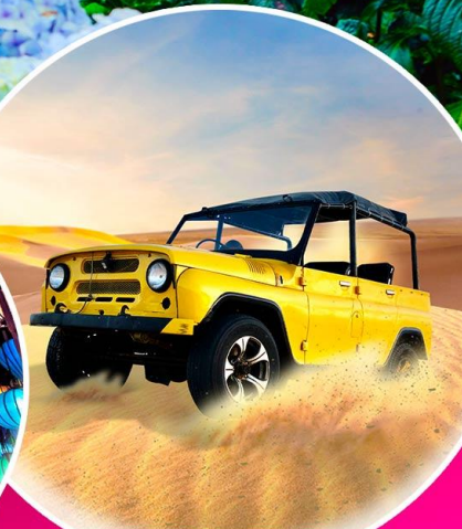
ฟรี! นั่งรถจี๊ป