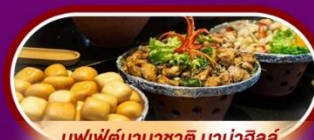
บุฟเฟ่ต์นานาชาติ บานาฮิลล์