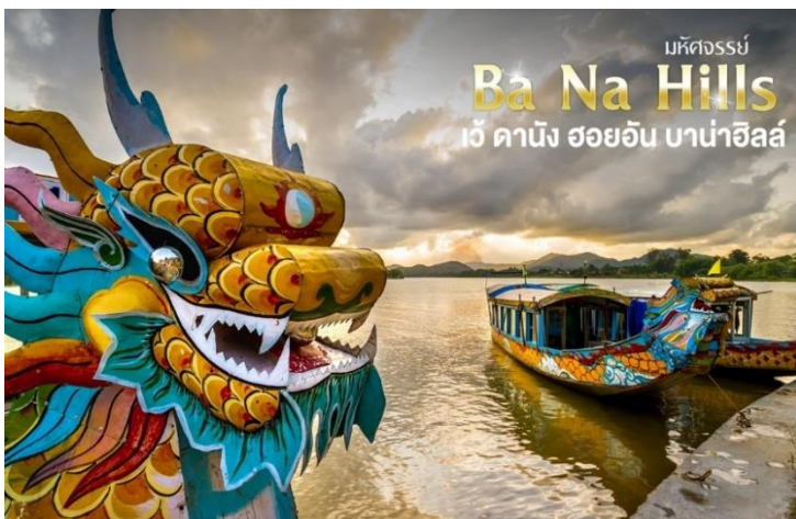
มหัศจรรย์ Ba Na Hills เว้ ดานัง ฮอยอัน บาน่าฮิลล์

นำท่าน ลงเรือมังกรล่องแม่น้ำหอม พร้อมชมการแสดงและดนตรีพื้นเมือง