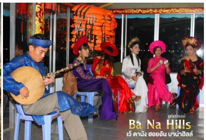
มหัศจรรย์ Ba Na Hills เว้ ดานัง ฮอยอัน บาน่าฮิลล์