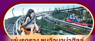
เล่นรถราง ชมวิวบานาฮิลล์