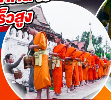
ตักบาตรข้าวเหนียว