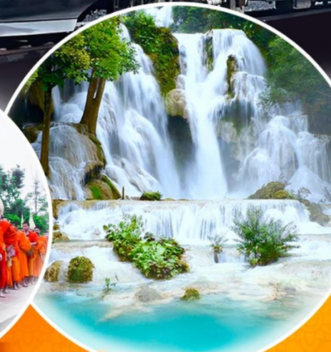
น้ำตกตาดกวางสี