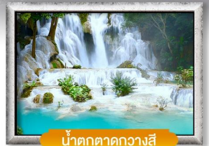
น้ำตกตาดกวางสี