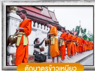
ตักบาตรข้าวเหนียว