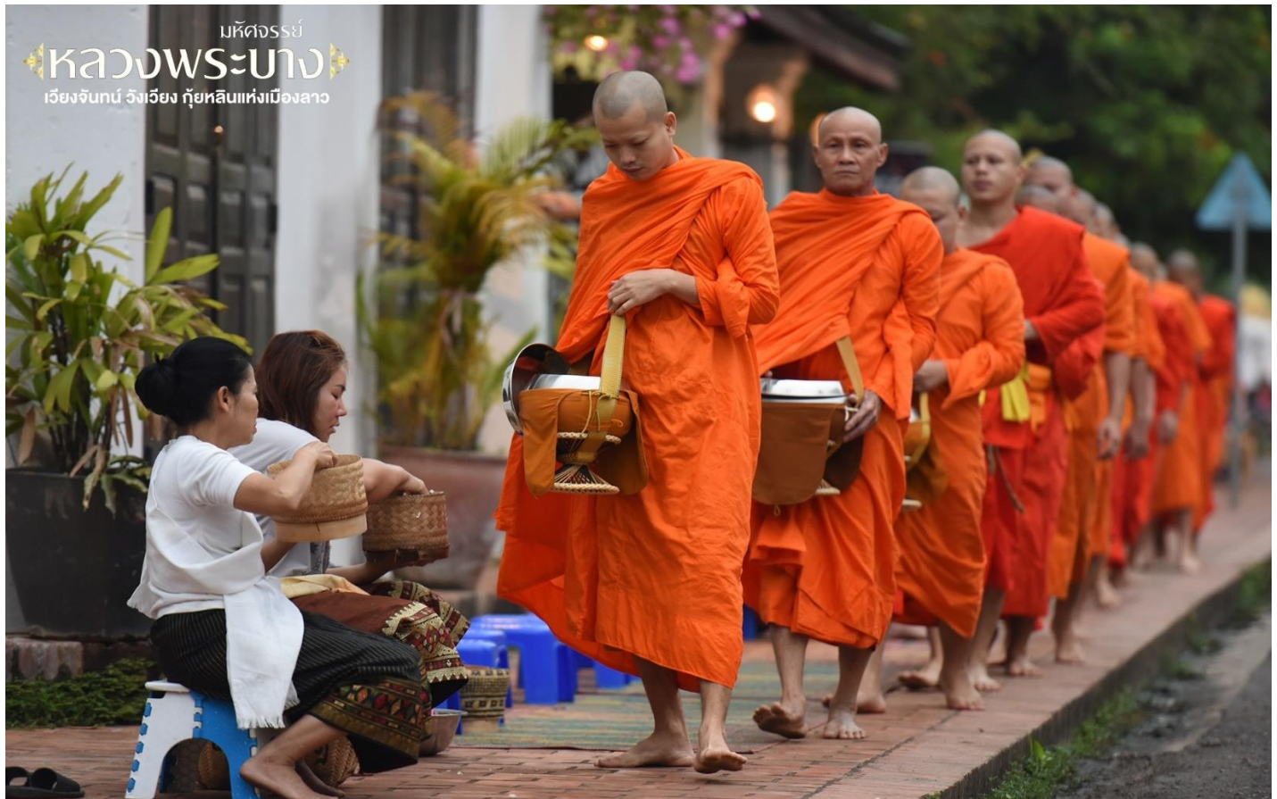
มหัศจรรย์ หลวงพระบาง เวียงจันทน์ วิังเวียง กุ้ยหลินแห่งเมืองลาว