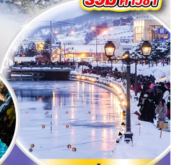
คลองโอดารุ