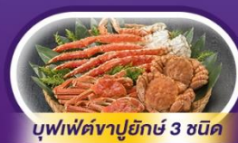
บุฟเฟ่ต์ญี่ปุ่น 3 ชนิด