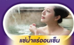
แช่น้ำร้อนเซน