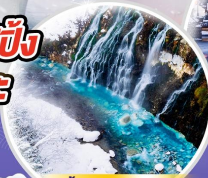
น้ำตกชิราอิเกะ