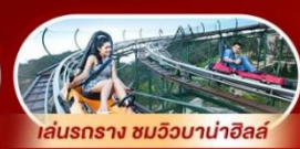
เล่นรอกาง ชมวิวบานาฮิลล์