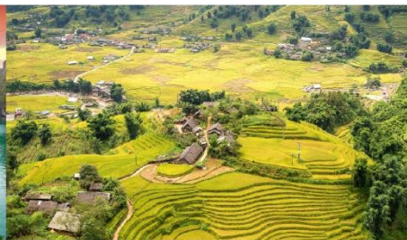
หมู่บ้านต่าฟาน

*กรณีห้องพักรับมาอีลล์เต็ม ขอสงวนสิทธิ์ในการเปลี่ยนวันเข้าพัก และปรับเปลี่ยนโปรแกรมโดยคำนึงถึงผลประโยชน์ลูกค้าเป็นสำคัญ