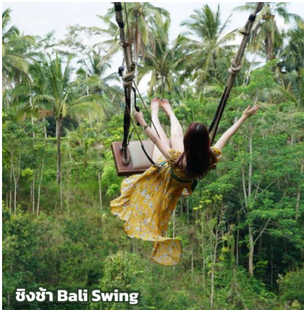
ชิงช้า Bali Swing

นำท่านสู่ Pelaga Eco Park หลีกหนีจากกิจวัตรประจำวันของคุณและพักผ่อนในสภาพแวดล้อมที่สวยงาม พาทั้งครอบครัวมาพักผ่อนที่บ้านธรรมชาติ! ถ่ายรูปพร้อมวิวหุบเขาแม่น้ำ สัมผัสประสบการณ์สุดพิเศษกับชิงช้า BALI SWING (รวมค่าบริการแล้ว)