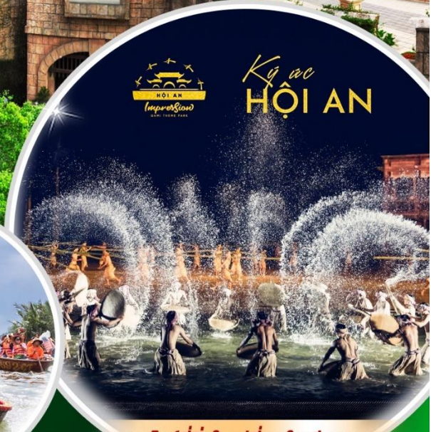
ชมโชว์ที่ยิ่งใหญ่ที่สุดในเวียดนาม Hoi An Impression Theme Park

นั่งกระเช้าที่ยาวที่สุดในโลก ขึ้นสู่บาน่าฮิลล์ ชมเมือง ฮอยอัน เมืองมรดกโลกที่สวยงามและเจียบสงบ พิเศษ!! บุฟเฟ่ต์นานาชาติ บาน่าฮิลล์