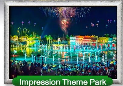
Impression Theme Park

เมนู สุดพิเศษ !! บุฟเฟ่ต์นานาชาติบนบาน่าฮิลล์