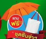
แถมฟรี!! ชุดชินจ่าว