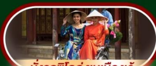
นั่งรถซิโครล์ ชมเมืองเว้

นั่งกระเช้าที่ยาวที่สุดในโลก ขึ้นสู่บาน่าฮิลล์ ชมเมือง ฮอยอัน เมืองมรดกโลกที่สวยงามและเจียบสงบ พิเศษ!! บุฟเฟ่ต์นานาชาติ บาน่าฮิลล์