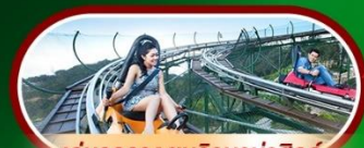
เล่นรถราง ชมวิวบาน่าฮิลล์