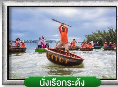
นั้งเรือกระดิง