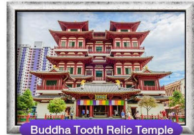
Buddha Tooth Relic Temple