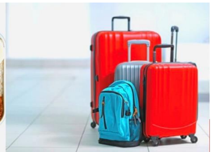
น้ำหนักกระเป๋า สูงสุด 20 กก.

10.40 น. เดินทางถึง สนามบินชิตเสะ ฮอกไกโด ประเทศญี่ปุ่น หลังจากผ่านขั้นตอนการตรวจคนเข้าเมืองของประเทศญี่ปุ่นแล้ว (เวลาที่ญี่ปุ่นเร็วกว่าไทย 2 ชั่วโมง กรุณาปรับเวลาของท่านให้ตรงกัน เพื่อสะดวกในการนัดหมายเวลา) ***สำคัญมาก!! ประเทศญี่ปุ่นไม่อนุญาตให้นำอาหารสด จำพวก เนื้อสัตว์ พืช ผัก ผลไม้ เข้าประเทศ หากฝ่าฝืนมีโทษปรับและจับ