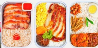
บริการอาหารร้อน ทั้งขาไป-ขากลับ