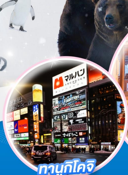
ทากุจิโคจิ