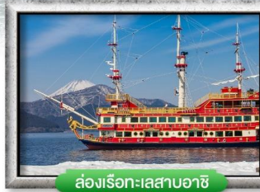
ล่องเรือทะเลสาบอาชิ