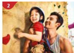
2 Rock Climbing Wall Challenge yourself on our mountainous rock climbing wall.