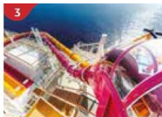
3 Waterslide Park Get drenched in fun on one of our six different waterslides.