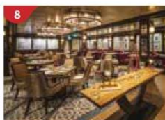
8 Bistro By Mark Best Relish contemporary Western cuisine from the internationally-acclaimed Australian chef.