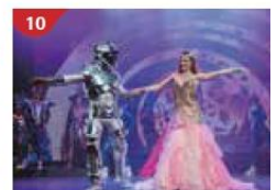
10 Zodiac Theatre Enjoy live production shows from the acclaimed award-winning entertainment team.