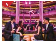
4 Bar 360 Catch live music and aerial acrobatic performances with a glass of champagne.