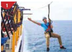
1 Ropes Course & Zipline Feel the thrill of gliding above the ocean on a 35-metre zipline.

เย็น รับประทานอาหาร ณ ห้องอาหารที่ทางเรือเตรียมไว้ให้