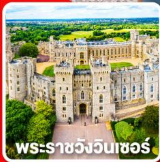
พระราชวังวินด์เซอร์

พักผ่อนคอน 4 คืนและ อิสระให้ท่านได้เที่ยวลอนดอนแบบเต็มอิ่ม 1 วัน