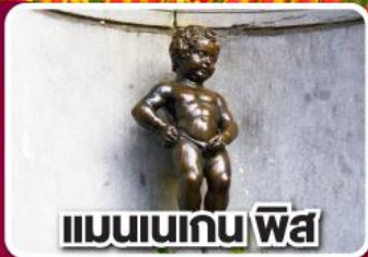
แมนเนเกน ฟิส