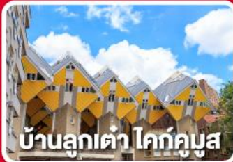
บ้านลูกเต่า โคกคูบุง