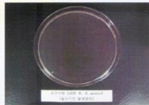
เชื้อซาลโมเนลลา