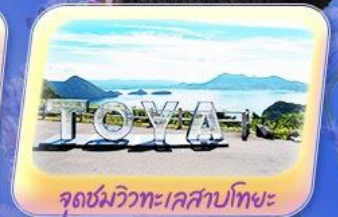
จุดชมวิวกะเลสาบโทยะ