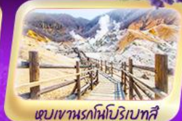
เขื่อนเขานรกหิมะโบราณโทชิ