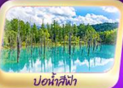
ปอน้ำสีฟ้า

22 - 27 ก.ค. 68 / 29 ก.ค.- 3 ส.ค. 68 12-17 ส.ค. 68 / 19-24 ส.ค. 68