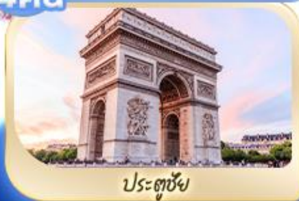
ประตูชัย