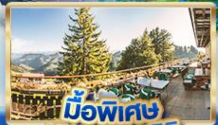
มือพิเศษ บนยอดเขาริคิ