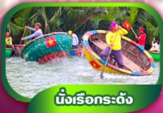
นั่งเรือกระดง