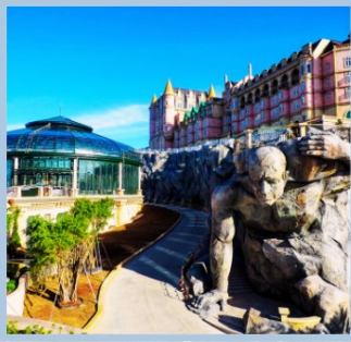
โซล Eclipse Square