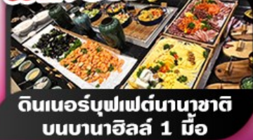
ดินเนอร์บุฟเฟต์นานาชาติ บนบานาฮิลล์ 1 มื้อ