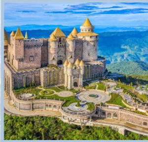
ปราสาทจันทร