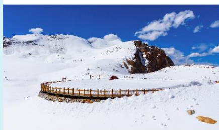
อุทยานต้ากู่ปิงชว่น