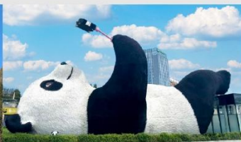
รูปปั้นหมีแพนด้าบนเซลฟี่