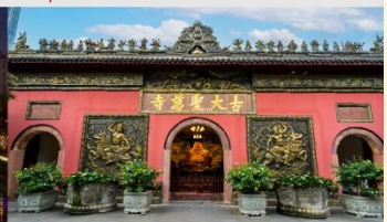
วัดต้าจ้อ