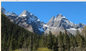
ภูเขาสี่ดรุณี (หุบเขาชวงเฉียวโกว)