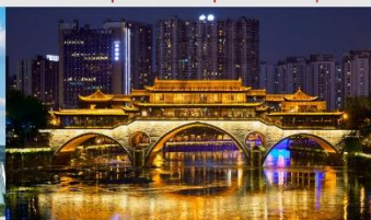
สะพานอันซุน