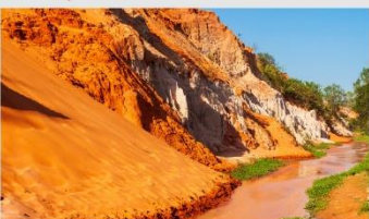
ลำธารนางฟ้า

*ทางบริษัทฯ ขอสงวนสิทธิ์ในการสลับโปรแกรมทัวร์ตามความเหมาะสมขึ้นอยู่กับสถานการณ์หน้างาน โดยคำนึงถึงผลประโยชน์ของลูกค้าเป็นสำคัญ