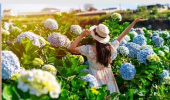
สวนดอกไฮเดรนเยีย