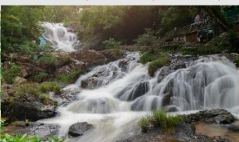
น้ำตกดาตันลา