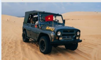
ทะเลทรายขาว